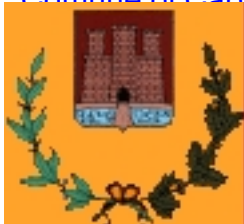
Comune di Capraia e Limite