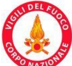
Vigili del Fuoco