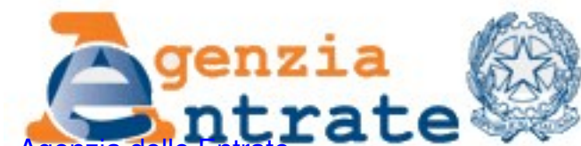
Agenzia delle Entrate