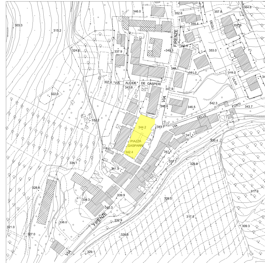
4_FIANO - PIAZZA GASPARRI